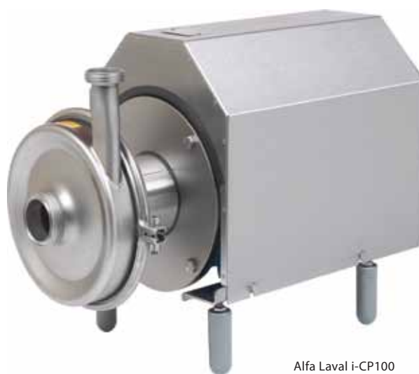
Alfa Laval i-CP100

A Alfa Laval i-CP100 é indicada para uso em processos alimentícios, laticínios, bebidas e indústrias de água, com garantia de limpeza das áreas de vedação.