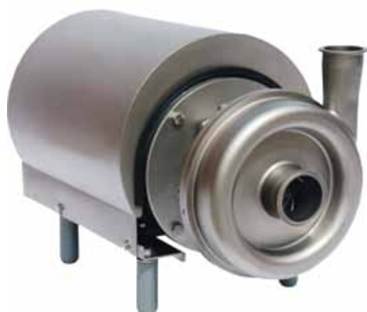
Alfa Laval i-CP2010